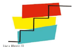
LÍNEA MARCO 10 ESTRATEGIAS PARA EL DESARROLLO Y MEJORA DE LA FORMACIÓN INICIAL Y EL APRENDIZAJE PERMANENTE.

La formación del profesorado acercará la realidad de nuestros entornos culturales, sociales y naturales a toda la comunidad educativa. El profesorado, desarrollando el espíritu crítico del alumnado, creará vínculos entre este y su entorno. Para lograrlo se potenciarán las formaciones que fomenten la conciencia cultural y natural y el respeto por las lenguas propias.