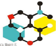
LÍNEA MARCO 6 ESTRATEGIAS PARA LA CREACIÓN Y CONSOLIDACIÓN DE LA ESTRUCTURA DE REDES DE COLABORACIÓN COMO ESTRATEGIA BÁSICA DE ORGANIZACIÓN EDUCATIVA.

Esta línea propone un modelo de formación que contribuirá a la creación de alianzas entre todos los miembros de la comunidad educativa que posibilite el abordaje eficaz de situaciones complejas en los diferentes contextos educativos. Además, promoverá la internacionalización y los proyectos europeos que ofrecen oportunidades de estudio, formación, experiencia laboral o voluntariado y cooperación en el extranjero.