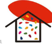
LÍNEA MARCO 4 ESTRATEGIAS PARA LA INCORPORACIÓN DE LOS OBJETIVOS DE DESARROLLO SOSTENIBLE EN EL AULA Y EN LOS CENTROS EDUCATIVOS.

La digitalización cambia la experiencia educativa de toda la sociedad por lo que el profesorado debe saber evolucionar y adaptarse. Se buscará garantizar los derechos educativos de todo el alumnado y profesorado mitigando la brecha digital tanto en el acceso como en el uso) y procurando asegurar que la tecnología llegue a la mayor parte de la población. Para ello se impulsará la competencia digital e informacional de la comunidad educativa y la creación, utilización y difusión de recursos educativos abiertos.