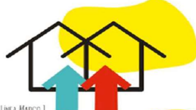
LÍNEA MARCO 1 ESTRATEGIAS PARA LA MEJORA DEL APRENDIZAJE.

Si queremos que el alumnado adquiera estrategias para resolver los problemas reales, desarrolle competencias, habilidades y formación en valores; debemos utilizar metodologías y estructuras organizativas que procuren una nueva forma de aprender: la escuela abierta y participativa, la formación a la comunidad educativa, la actualización científica y curricular del profesorado, la profundización metodológica, el trabajo sobre evidencias científicas, la adquisición de competencias comunicativas en diferentes lenguas y la evaluación del aprendizaje.