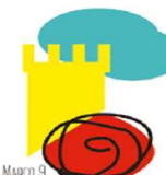
LÍNEA MARCO 9 ESTRATEGIAS PARA EL CONOCIMIENTO DEL ENTORNO CULTURAL Y NATURAL.

Esta línea busca una mejora de los centros educativos ya que desempeñan un papel activo a la hora de proporcionar y garantizar el bienestar social, físico y emocional del alumnado y del profesorado. Para ello se realizarán formaciones sobre espacios; educación socioemocional; salud, prevención, riesgos y hábitos saludables; desarrollo personal, bienestar subjetivo y ajuste social.