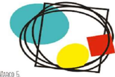
LÍNEA MARCO 5 ESTRATEGIAS PARA LA MEJORA DE LA CONVIVENCIA, LA INCLUSIÓN Y LA IGUALDAD.

La formación dotará al profesorado de las herramientas necesarias para desarrollar un modelo de enseñanza que favorezca el pensamiento crítico, creativo y transformador en el alumnado; y que lo empodere para tomar decisiones conscientes y actuar responsablemente frente a los retos y desafíos que plantean los ODS. La educación, a través de la innovación, la creatividad, la equidad y la evaluación es imprescindible para alcanzar los ODS.