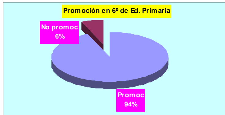
Gráfico P4. Porcentaje de alumnado promocionado en sexto de Educación Primaria en Aragón

promociona es ligeramente superior en el primer ciclo (6,73%) que en los otros dos ciclos. Los resultados medios mejoran los resultados del año académico 2007-2008 en 0,5 punto porcentual